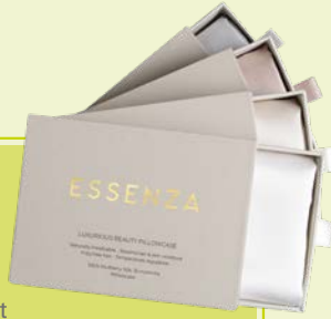
3. SEIDEN-SCHLAFMASKE 29,95 IN EDLER GESCHENKBOX ESSENZA