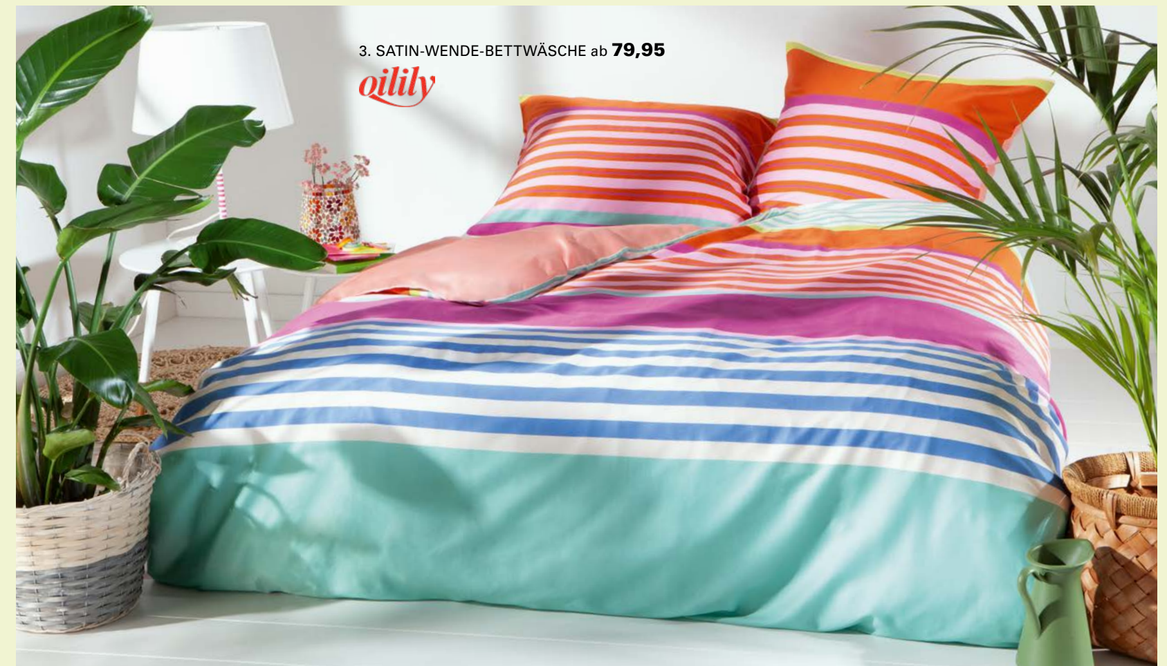
3. SATIN-WENDE-BETTWÄSCHE ab 79,95