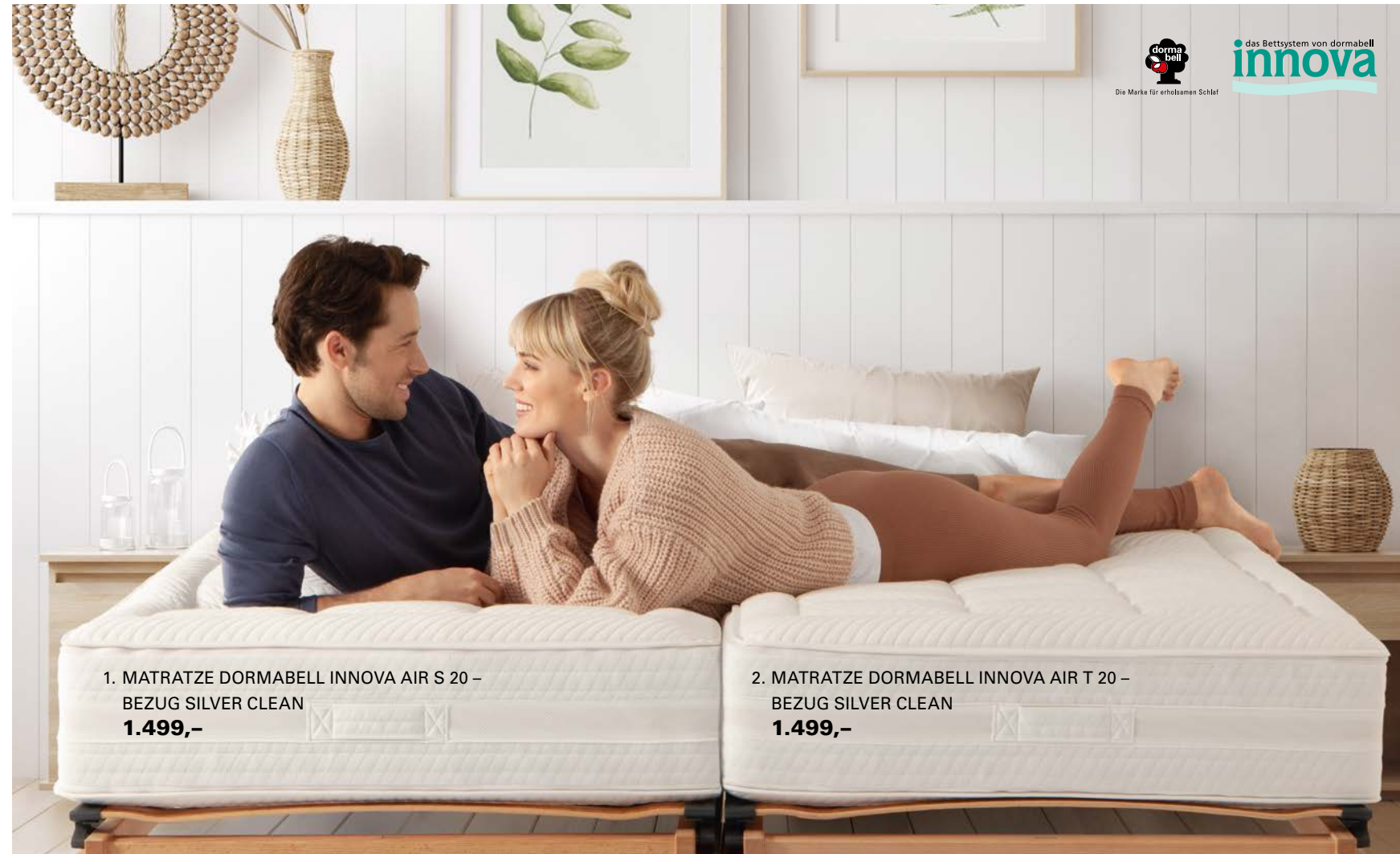
1. MATRATZE DORMABELL INNOVA AIR S 20 – BEZUG SILVER CLEAN 1.499,-

Matratze ist ein Bett nur halb so bequem. Der Körper sollte sanft einsinken können, aber auch ideal gestützt und getragen werden. Für individuellen Wohlfühlkomfort sind Matratzen von dormabell Innova in mindestens drei Festigkeitsstufen mit verschiedenen Bezügen und optional mit Topper erhältlich.