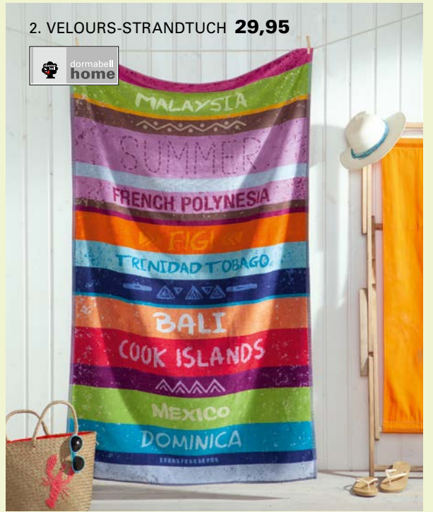
2. VELOURS-STRANDTUCH 29,95