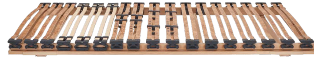
5. RAHMEN DORMABELL INNOVA N 649,-

1. MATRATZE DORMABELL INNOVA AIR S 20 – BEZUG SILVER CLEAN: Für hervorragenden Komfort. MTS biosyn®, ein Schaum auf natürlicher Basis, sorgt für hohe Oberflächenelastizität und Druckentlastung bei ergonomisch optimaler Stützkraft. Preisbeispiel: 90 / 200 cm, 100 / 200 cm, medium, 1.499,-. 2. MATRATZE DORMABELL INNOVA AIR T 20 – BEZUG SILVER CLEAN: In Optik, Höhe und Funktion identisch mit der dormabell Innova Air S 20. Der entscheidende Unterschied: Ein sehr punktelastischer, anschmiegsamer Tonnen-Taschenfederkern sorgt für die perfekte Körperanpassung, gibt sanft nach oder stützt dynamisch ab. Preisbeispiel: 90 / 200 cm, 100 / 200 cm, medium, 1.499,-. 3. MATRATZE DORMABELL INNOVA AIR S 18 – BEZUG SILVER CLEAN: Liegekomfort der besonderen Klasse verbunden mit sehr guten ergonomischen und klimatischen Eigenschaften. Ideal für Schläfer, die eine anschmiegsame Matratzenoberfläche bevorzugen. Auch für Gewichtsklassen bis ca. 140 kg zu empfehlen. Preisbeispiel: 90 / 200 cm, 100 / 200 cm, medium, 1.199,-. 4. MATRATZE DORMABELL INNOVA AIR T 18 – BEZUG SILVER CLEAN: Die sehr guten Liegeeigenschaften des Tonnen-Taschenfederkerns werden durch die Feinzonierung der Polsterung mit dem Schaum MTS biosyn® unterstützt. Mit innovativer Belüftungstechnik für ein ausgeglichenes Schlafklima. Preisbeispiel: 90 / 200 cm, 100 / 200 cm, medium, 1.199,-.